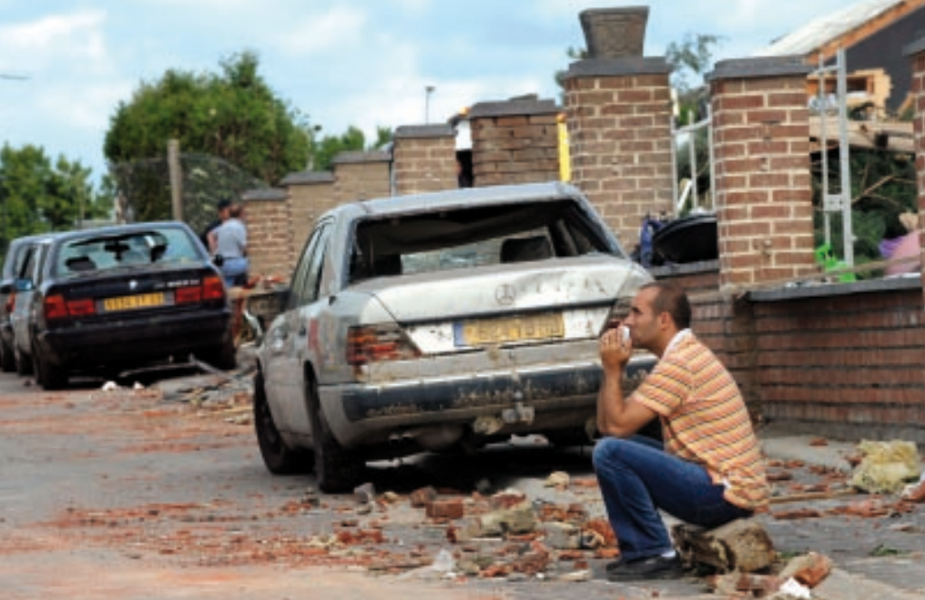
• Hautmont, augustus 2008: totale verwoesting nadat er een zware F4-tornado langstrok.

ongevaarlijke waterhozen meerekenen”, vertelt Hamid. Toch zal het werkelijke aantal wel wat hoger liggen. Hamid: “Als een hoos slechts over enkele akkers trekt of ’s nachts plaatsvindt, wordt hij moeilijk opgemerkt.”